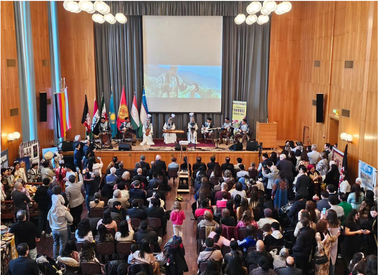
Nowruz-Fest mit Musikbeiträgen aus Afghanistan, Aserbaidshan, dem Irak, Kasachstan, Kirgisistan, Pakistan, Tadschikistan und Usbekistan am 15. März im Bürgersaal des Rathauses von Berlin-Zehlendorf

Sehr geehrte Damen und Herren, liebe Mitglieder und Freunde des Bundesverbandes Deutscher West-Ost-Gesellschaften, Navruz – Nawroz – Nauruz – Nouroz so heißt das Neujahrs- und Frühlingsfest in den verschiedenen Ländern des Balkans, des Kaukasus, in Süd- und Zentralasien. Das Fest wird rund um den 20./21. März, der Tag-und-Nacht-Gleiche im Frühjahr, in vielen Ländern als „Sieg des Lichts über die Dunkelheit“ gefeiert. Zum Teil gibt es rund um den Festtag vieltägige Feierlichkeiten, denn dieser Tag gilt nicht nur als Fest des Frühlings- und des Jahresbeginns, sondern auch als Tag der Völkerfreundschaft! In den Wochen seit der Bundestagswahl konnten wir schon einmal erfahren, wie sich die neue Bundesregierung aufstellen will inklusive der noch schnellen Durchsetzung der „Sonder-Schulden“ in Höhe von 1 Billion Euro, die in Aufrüstung und Infrastruktur fließen sollen. Deutschland und Europa arbeiten weiter mit Hochdruck daran, kriegstüchtig zu werden. Da rückt die Völkerfreundschaft wohl in weite Ferne, nichtsdestotrotz werden wir wahrscheinlich in den nächsten Wochen oder Monaten auch sehen, ob es nicht doch einen Weg Richtung Frieden im Krieg in der Ukraine gibt. Ein Frieden der allen Seiten gerecht werden und wirklich Sicherheit, wenn nicht sogar eine neue Sicherheitsarchitektur nach Europa bringen sollte.