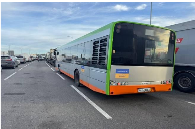
In Wartestellung an der Grenze

Ein Schwerpunkt unserer Arbeit war zweifellos die Unterstützung der ukrainischen Stadt Kamianets Podilskij, mit der die Stadt Esslingen eine so genannte Solidaritätspartnerschaft geschlossen hat. Das gesamte Jahr über wurden Hilfsgüter und Geldspenden gesammelt. Von den Geldspenden konnte im Sommer in enger Zusammenarbeit mit der Abteilung Städtepartnerschaften und Internationale Beziehungen der Stadt Esslingen und dem Verein bamberg:ua ein Schulbus gekauft werden.